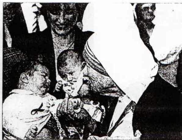
Madre Teresa di Calcutta con due piccoli orfani